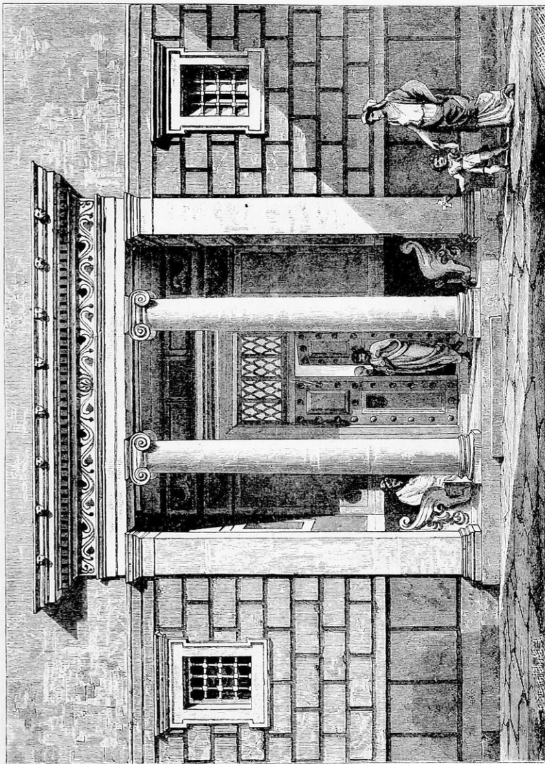
Είκ. 1. Πρόθυρον Ἑλληνικῆς οἰκίας.