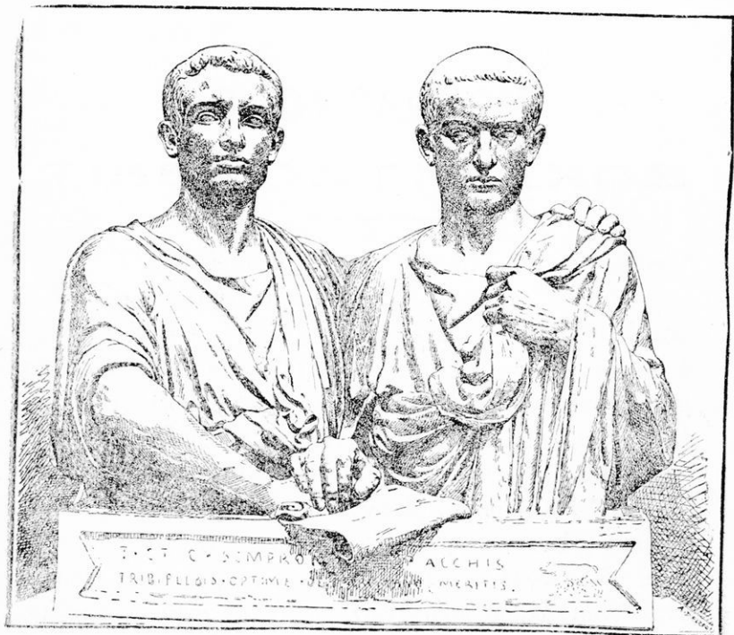
ΤΙΒΕΡΙΟΣ ΚΑΙ ΓΑΪΟΣ ΓΡΑΚΧΟΣ