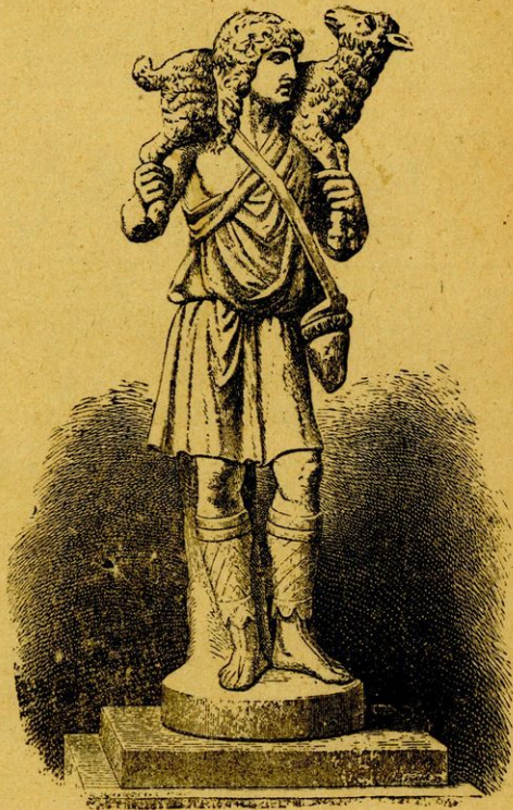
Ὁ καλὸς ποιμὴν.